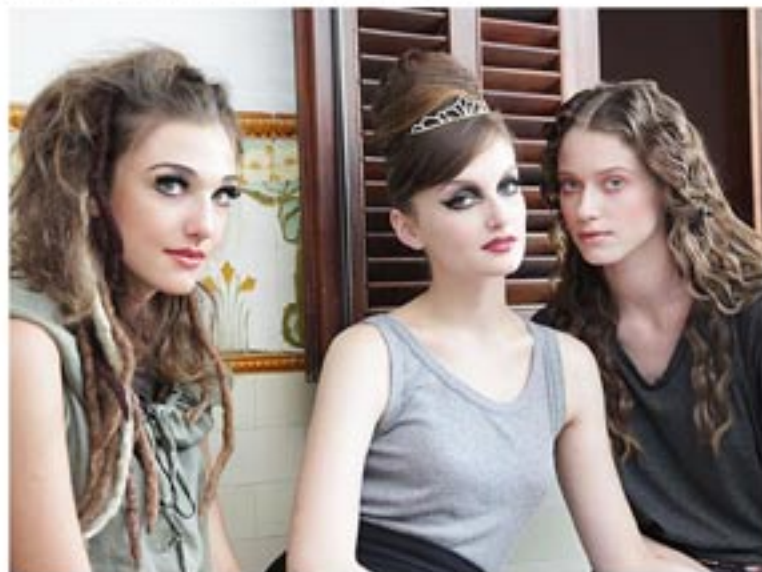
As modelos foram preparadas por Celso Kamura