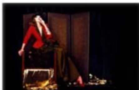
Irina Ionesco pour Stiletto © Irina Ionesco