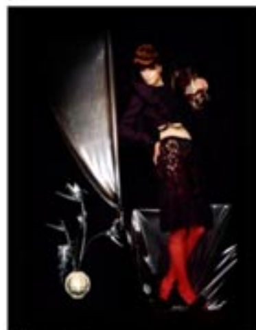
Irina Ionesco pour Stiletto