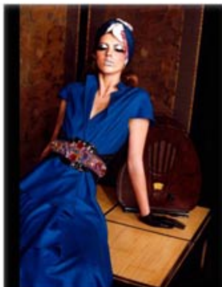
Irina Ionesco pour Stiletto © Irina Ionesco

Stiletto Gallery << Article précédent | Article suivant >>