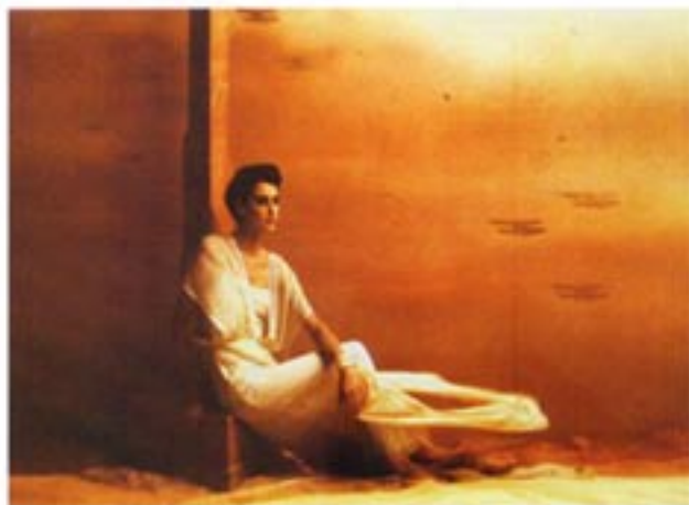
Irina Ionesco, Inès de la Fressange , 1985, tirage cibachrome (©Irina Ionesco, courtesy galerie EGP).

Née en 1935, Irina Ionesco peut se réjouir d'avoir eu une vie bien remplie. Enfant, elle quitte la Roumanie et gagne Paris avec sa grand-mère en 1948. Tout d'abord danseuse et contorsionniste, elle s'adonne à la peinture à la faveur d'un problème de santé qui la mène au