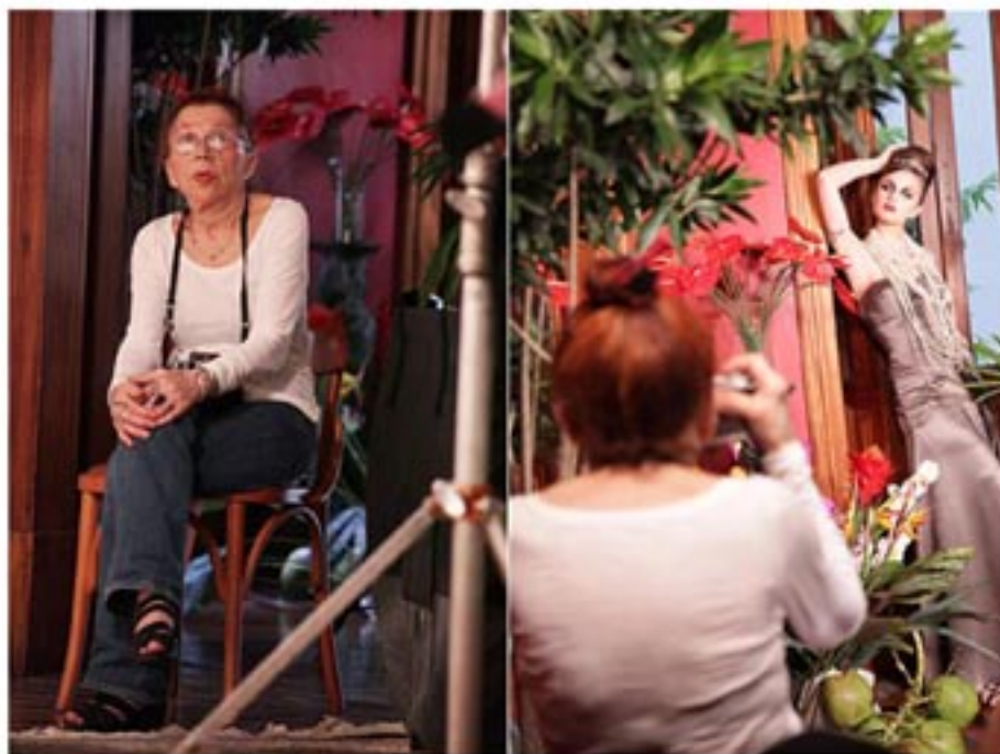
Irina Ionesco fotografa em casarão do Flamengo, no Rio de Janeiro

Requisitada no universo da moda internacional, Irina já assinou o editorial de moda de grifes internacionais badaladas como Yves Saint Laurent, Dior, Givenchy e Balenciaga, além das joalherias Cartier e Van Cleef & Arpel, entre outras.