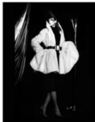
Irina Ionesco pour Stiletto © Irina Ionesco