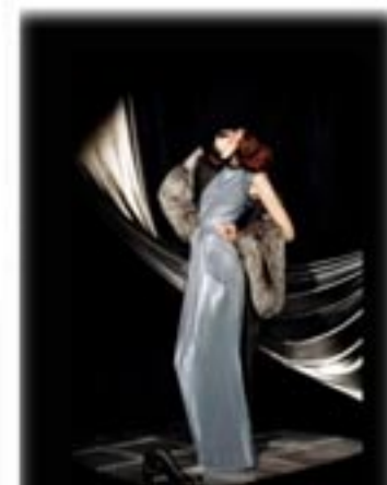
Irina Ionesco pour Stiletto © Irina Ionesco