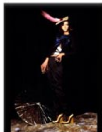
Irina Ionesco pour Stiletto © Irina Ionesco