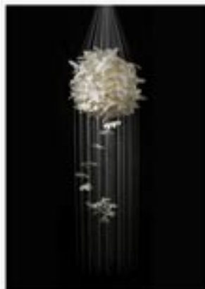
Tsuyu, Mesdames Butterflies